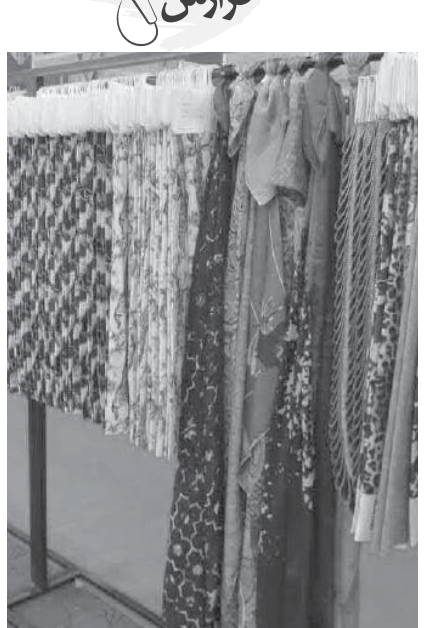
على رغم افزايش قيمت دلار، به اصطلاح آب از آب تكان نخورد!

منتها در سال جاری برخی مسائل مانند نوسان دلار و شهادت رئیس جمهور، بازار کشور را هیجانی کرد جالب اینجاست که همیشه با افزایش نرخ دلار، بازار گرم می شود و درخواست مشتریان افزایش پیدا می کند تا از قافله تورم عقب نمانند ولی امسال